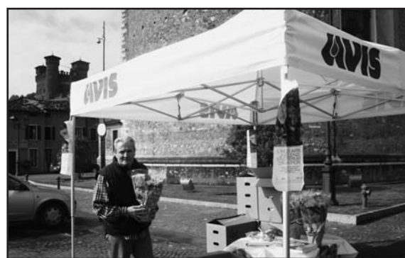
Il punto AVIS per il telefono azzurro.

Un servizio di emergenza per l'infanzia e contro la pedopornografia, un servizio ed un contributo quindi per una nobile causa.