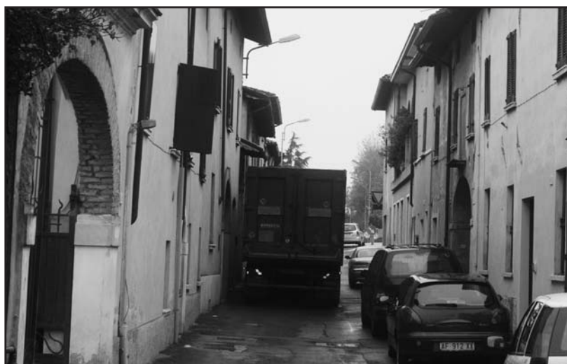
Via A. Mazzoldi: il passaggio degli autocarri crea pesanti disagi agli abitanti e comporta gravi pericoli.

Ora l'unica possibilità per i mezzi pesanti di arrivare al complesso industriale è quella che si può vedere in questa fotografia scattata alcuni giorni fa: in via A. Mazzoldi è praticamente impossibile uscire di casa, se non a grosso rischio per la propria incolumità.