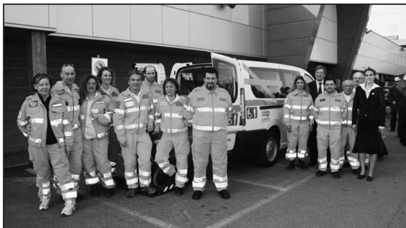
Il gruppo monteclarese della Croce Bianca accanto alla nuova unità mobile.