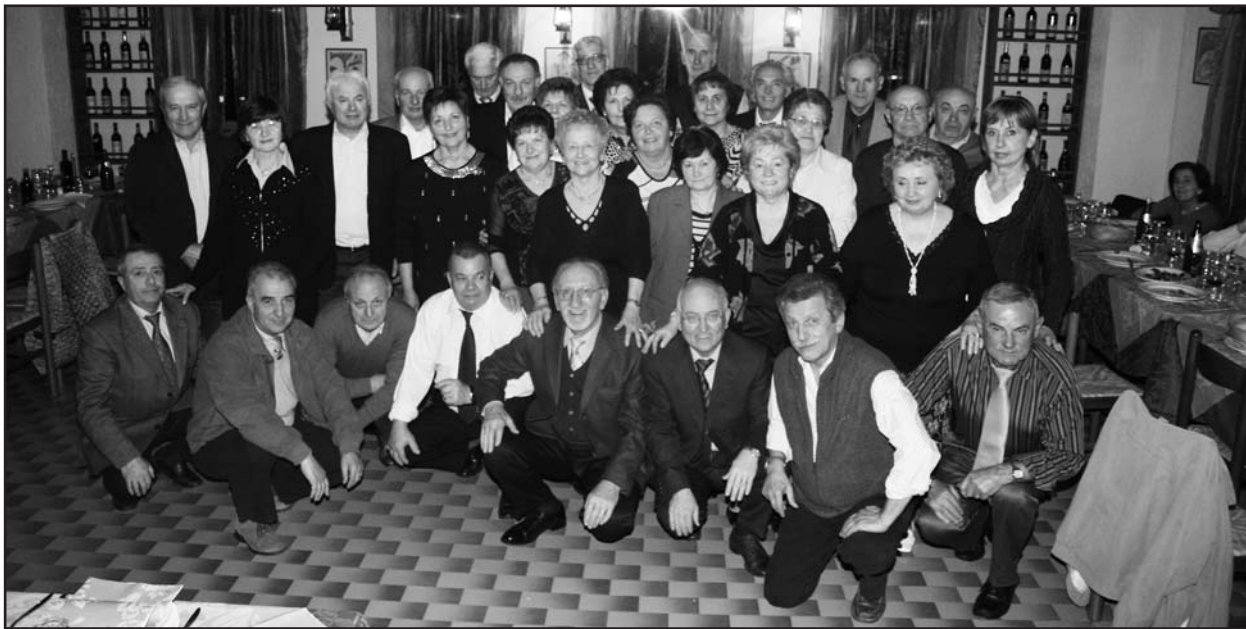
La classe 1943 presso la Trattoria S. Margherita.