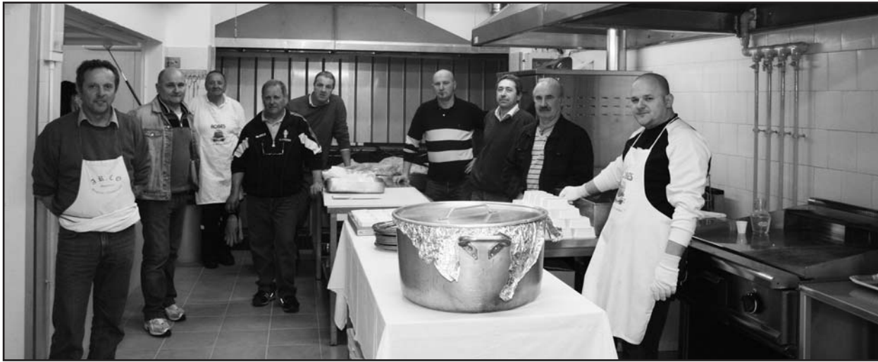
Il gruppo sportivo di Borgosotto orgoglioso della nuova sistemazione della cucina.