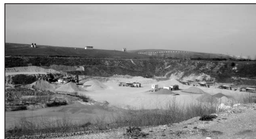
Paesaggio lunare nella zona di Vighizzolo. Approvata una nuova discarica di rifiuti speciali (scorie industriali) nella ex cava Gabana.