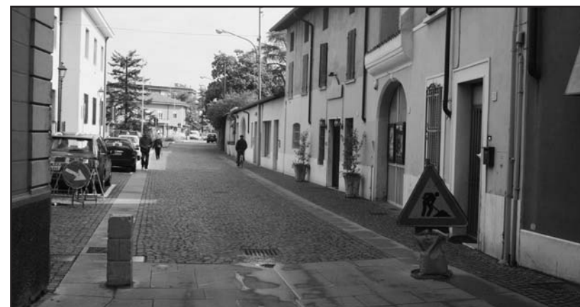
I pilastrini di via Cavallotti, ripetutamente divelti dagli automobilisti.

Chi si stancherà per primo? L'Automobilista, di abatterli o l'Amministratore, di rimetterli in piedi?